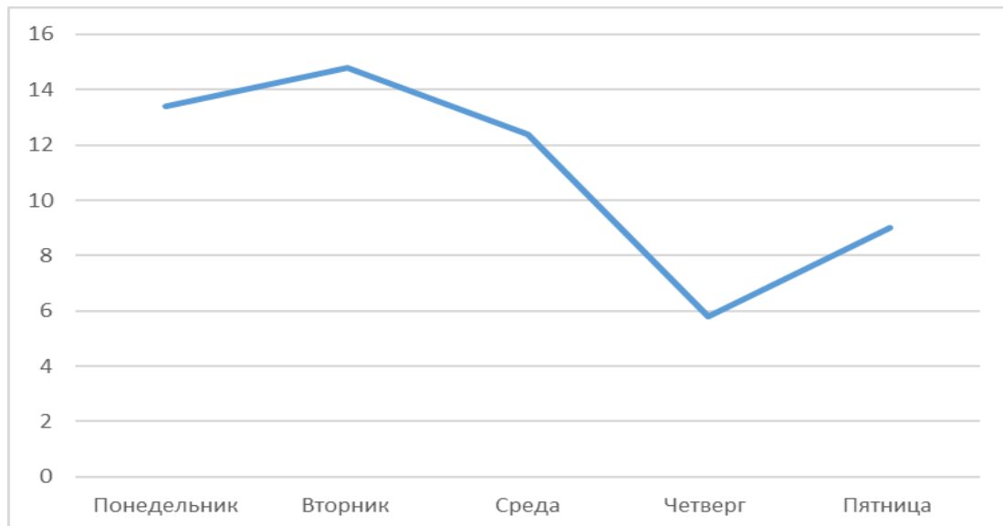
График недельной нагрузки